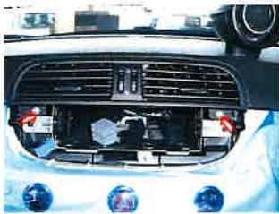
2箇所のネジを外す