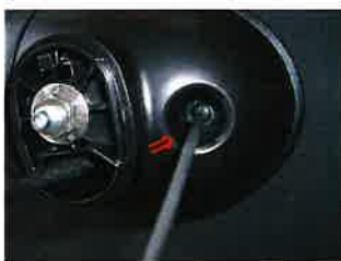
ネジを外し下のカバーを分解