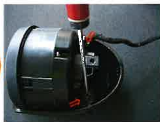
2箇所のネジを外す