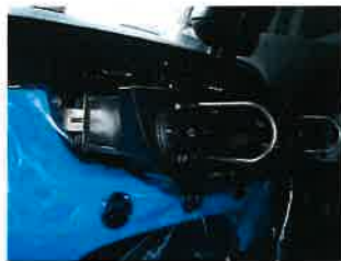
ツールを使い引き出す