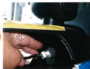
メーターカプラーを外す