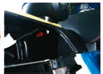
ナットを緩めメーターを外す