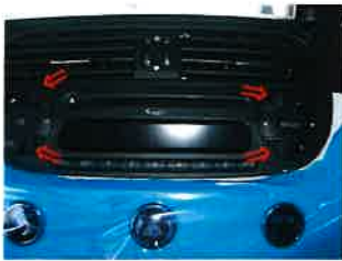
4箇所のカバーを外す